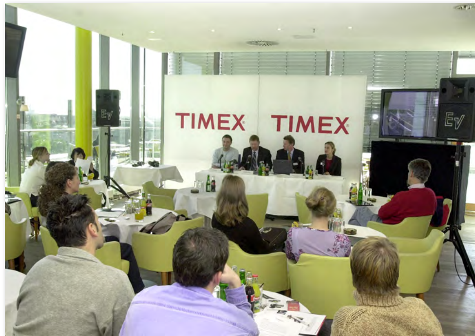
Auftakt-Pressekonferenz auf der Dach-Arena und im Restaurantbereich von Sport Karstadt in Hamburg 24.09.2002